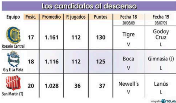
Ejemplo de tabla

El diagrama es un gráfico que puede precisar de mayores habilidades artísticas. Suelen contener dibujos más o menos complejos y leyendas o breves textos que aclaran datos. Pueden tener un carácter descriptivo: mostrar cómo es un objeto desde diferentes ángulos, o desde su interior; o narrativos: exponer la secuencia de unos hechos, por ejemplo.