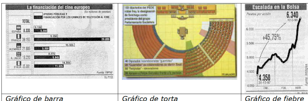
Gráfico de barra

Los gráficos. Son los que usan con más frecuencias en los periódicos y presentan información numérica y estadística. Se dividen, a su vez, en gráficos de barra, de torta y de fiebre.